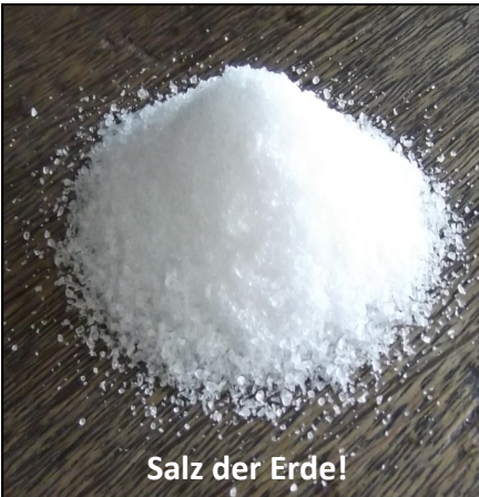
Salz der Erde!