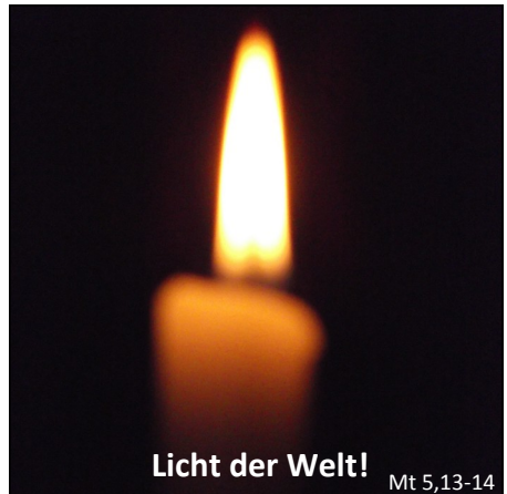
Licht der Welt!