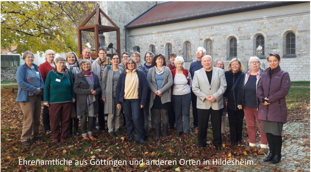
Ehrenamtliche aus Göttingen und anderen Orten in Hildesheim.

Im November ging es dann für Teile des Teams zur Fortbildung ins „Zentrum für Gottesdienst und Kirchenmusik“ im Michaeliskloster in Hildesheim. Dort traf man sich unter dem Stichwort „Alter Wein in neue Schläuche“ mit anderen Ehrenamtlichen, tauschte Erfahrungen aus und lernte Neues.